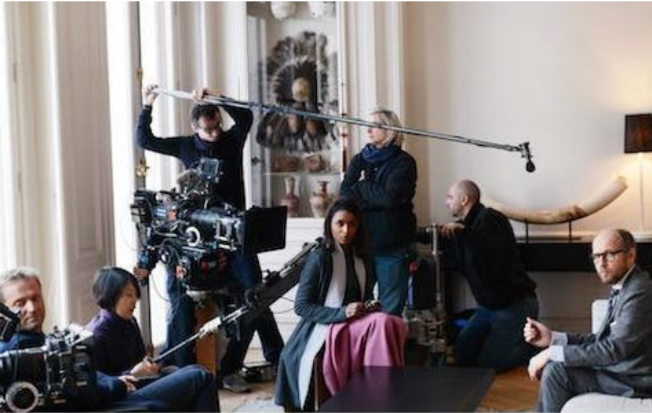
Direction de production : un stage à la carte