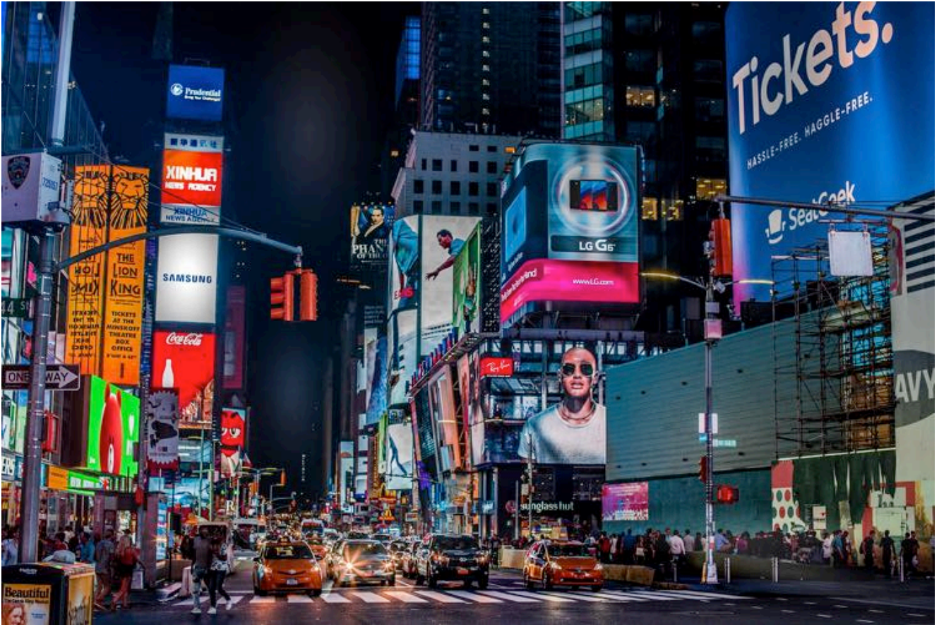
Acquérir la stature d'un producteur pub, sûr et efficace