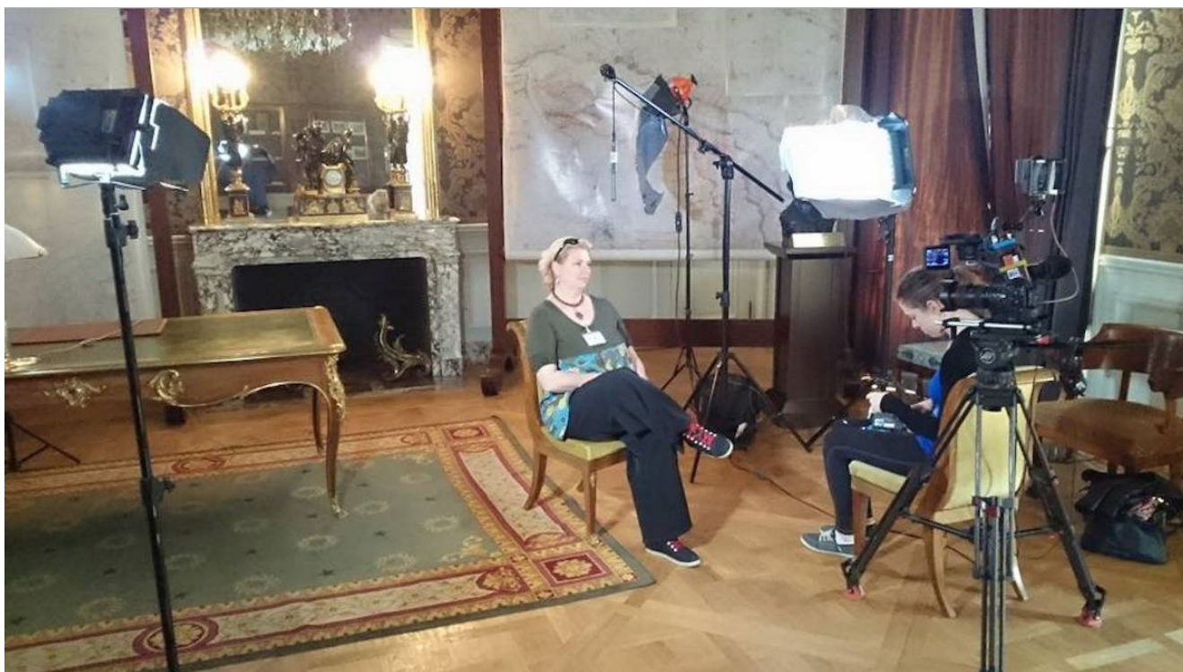
Produire un documentaire pour la télévision