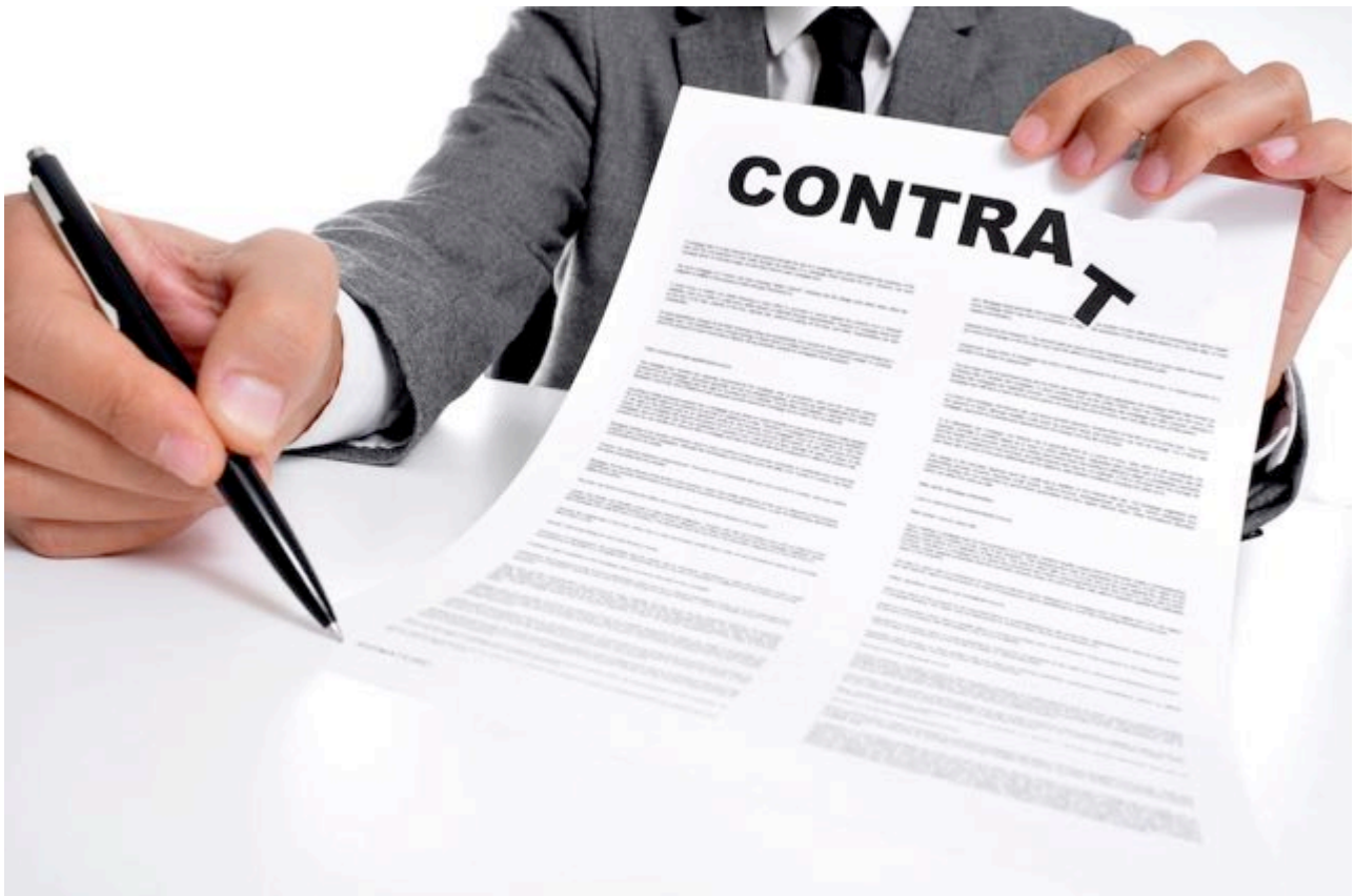
Déjouer les pièges des contrats d'auteur