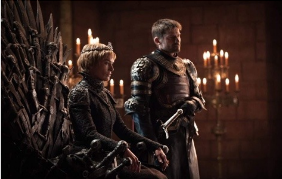
Directeur de production en fiction télé, les indispensables